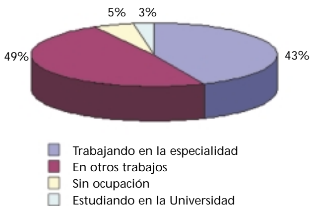
FIGURA 2: MUESTREO LABORAL REALIZADO POR LA ESCUELA SOBRE UN 20% DE LOS ALUMNOS EGRESADOS

En la Figura 2 se muestra que la mayor parte de los egresados encuentra trabajo, ya sea en ocupaciones directamente relacionadas con su formación específica, así como en otras tareas. El porcentaje de desocupación detectado es notablemente inferior a la media nacional y de la zona. Muchos de los que trabajan en tareas ajenas a las de su formación específica han sido retenidos por empresas comerciales o de servicios por su potencial detectado en el montaje o pue-