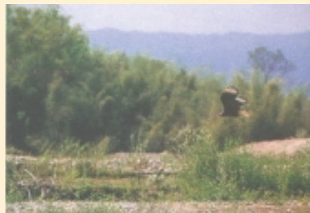
Provincia de Salta

TGN, en su política, renueva el compromiso de la dirección de la Empresa de cuidar el medio ambiente y sus recursos natu-