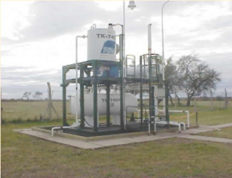
Planta Ecológica Modular "Típica"

2- No provocan emulsiones que podrían dificultar la tarea del equipo separador de fases.