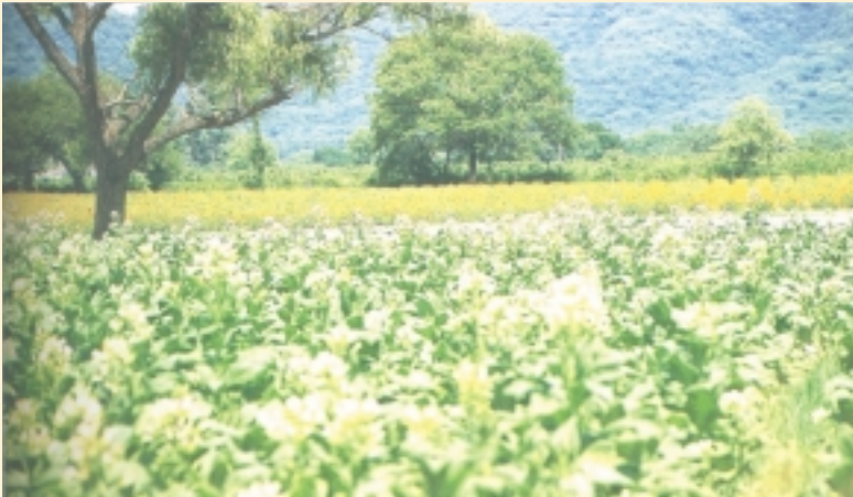
Plantación de Tabaco Pcia. de Jujuy