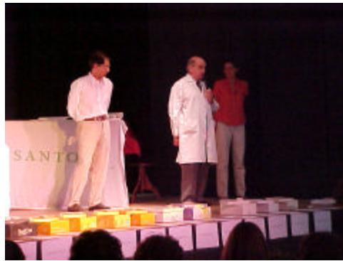
Foto: tarjetas de agradecimiento de los niños