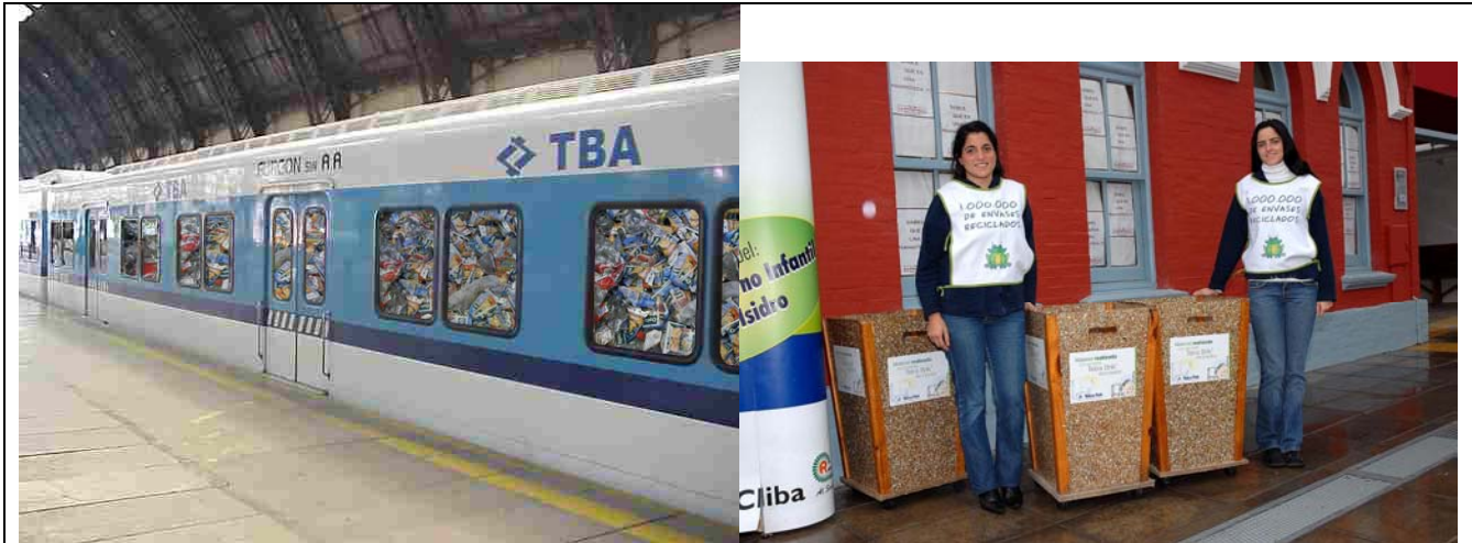
Evento realizado en el marco del Día del Medio Ambiente 2006 cuando se recolectaron 1.000.000 de envases