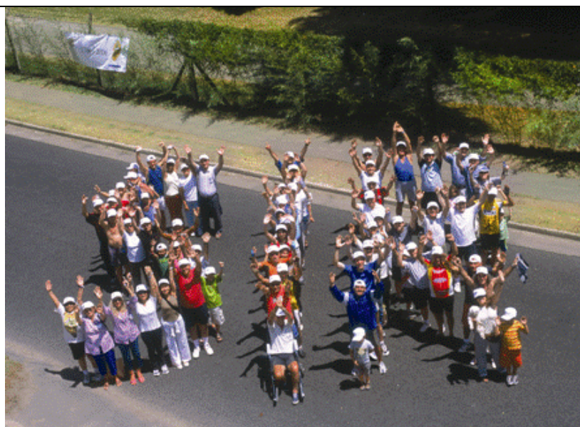
Jornada de celebración de fin de año con los vecinos de San Isidro