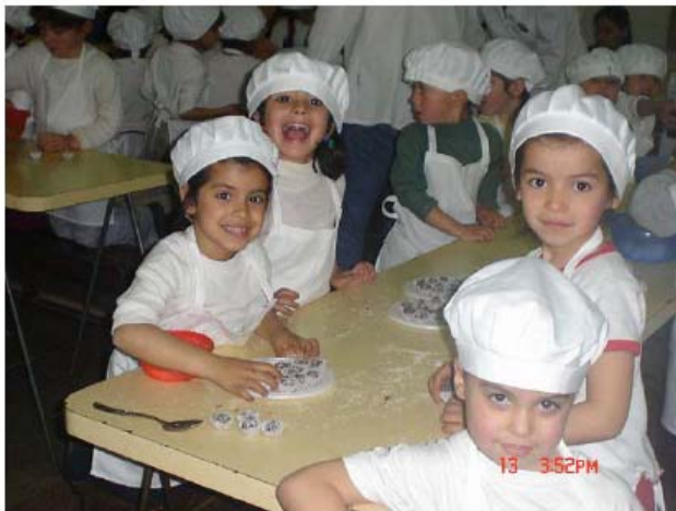
"Proyecto La Sartén por le mango" Escuela Carande Carro