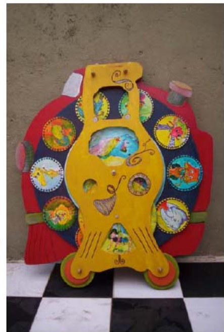
Juguete "El tren del Mundo", creado dentro del Programa de Educación Temprana