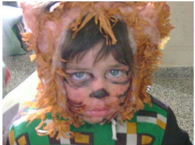
Proyecto "Nos comunicamos y expresamos a través del arte en el Jardín"- Jardines Cabal, Stokoe y Villafañe