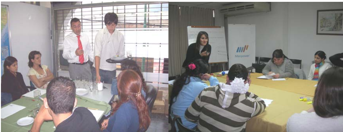
Arriba Izq: Voluntario de Manpower dictando taller para mozos y camareros en Villa Martelli.

Además, en el corto plazo se pretende desarrollar un nuevo espacio dentro del programa para que los voluntarios de Manpower vinculados al negocio agroindustrial puedan dictar talleres de concientización y sensibilización para trabajadores rurales sobre la problemática del trabajo infantil rural.