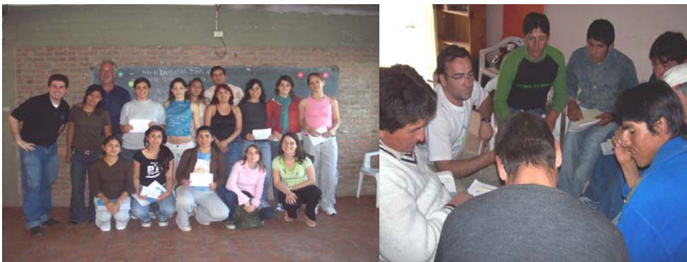
Arriba Izq: Cierre Taller de jóvenes de la organización Aprendiendo a Ser, Boulogne.