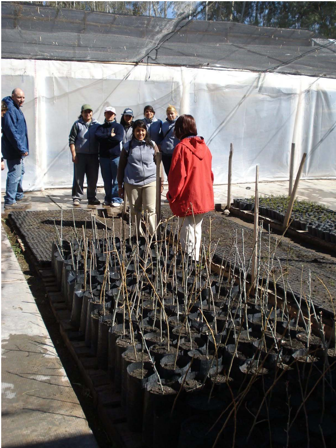
Producción de plantines