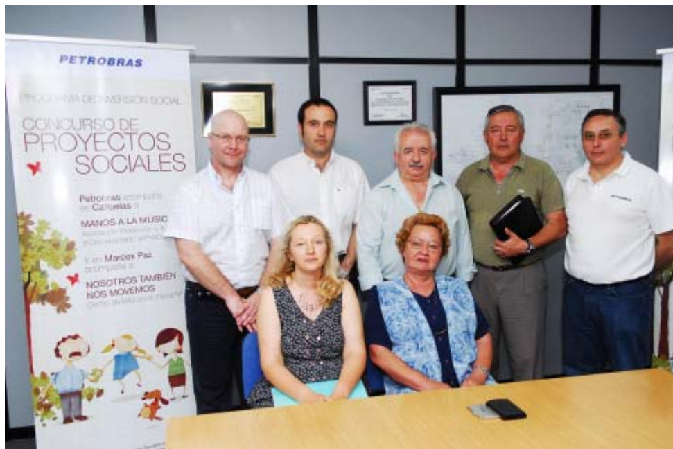
Acto de reconocimiento a los ganadores del Concurso de Proyectos de la Localidades de Cañuelas y Marcos Paz . En la foto, APYAD, perteneciente a Cañuelas.

Petrobras Energía acompañará durante el año 2009 estos 10 proyectos -todos deben ejecutarse dentro del año calendario- brindando apoyo económico, asesoramiento y evaluando su ejecución.