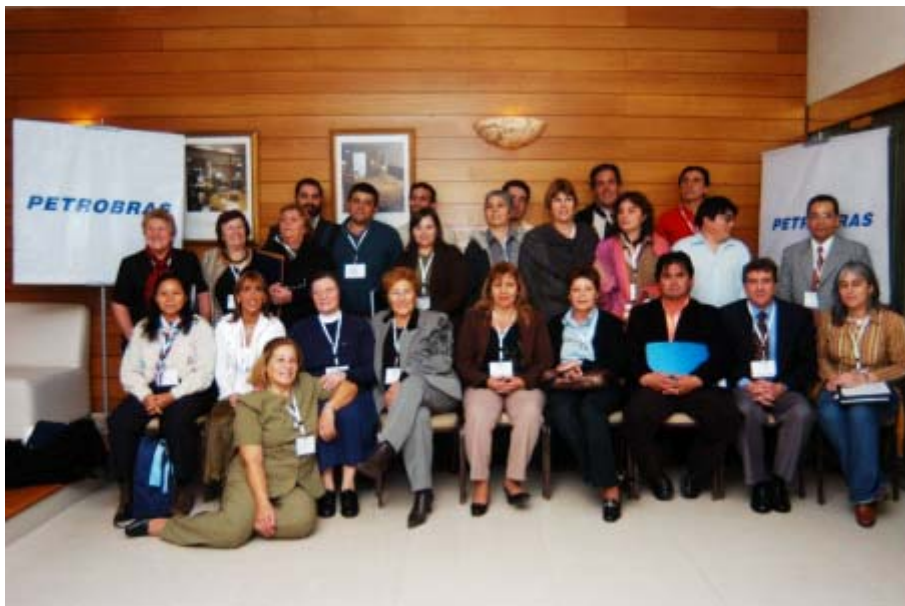
Participantes del Diálogo Participativo con ONG's.