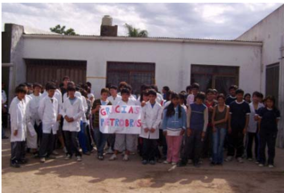
Alumnos de la Escuela Básica Nro. 13, de Zárate, provincia de Buenos Aires. Su proyecto “Gente de Buena Madera”, de retención escolar, resultó uno de los ganadores del primer concurso de proyectos.

Siguiendo esta idea, el Concurso de Proyectos Sociales Petrobras Energía 2008 prevé realizar una etapa de seguimiento de los proyectos ganadores que permita no sólo monitorear que las metas estipuladas sean llevadas a cabo, sino también brindar herramientas para posibilitar el trabajo territorial, abriendo un espacio concreto para que las organizaciones reflexionen y orienten su trabajo a través de jornadas de capacitación.